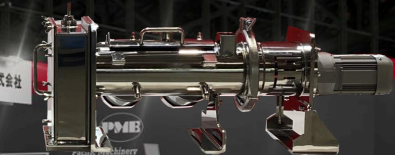
WA10型 パムアペックスミキサ