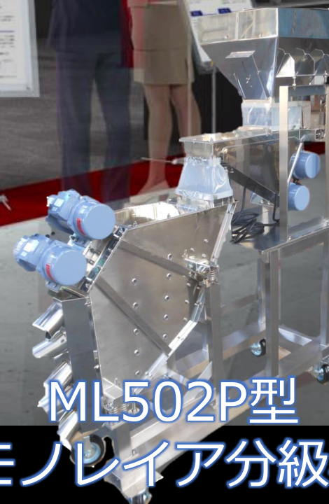
ML502P型 モノレイア分級機