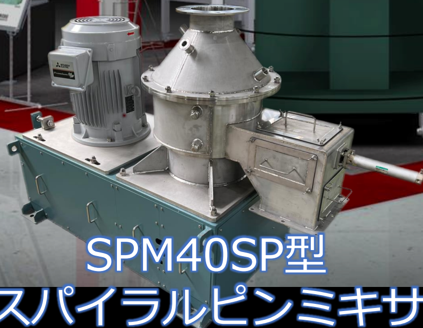
SPM40SP型 スパイラルピンミキサ